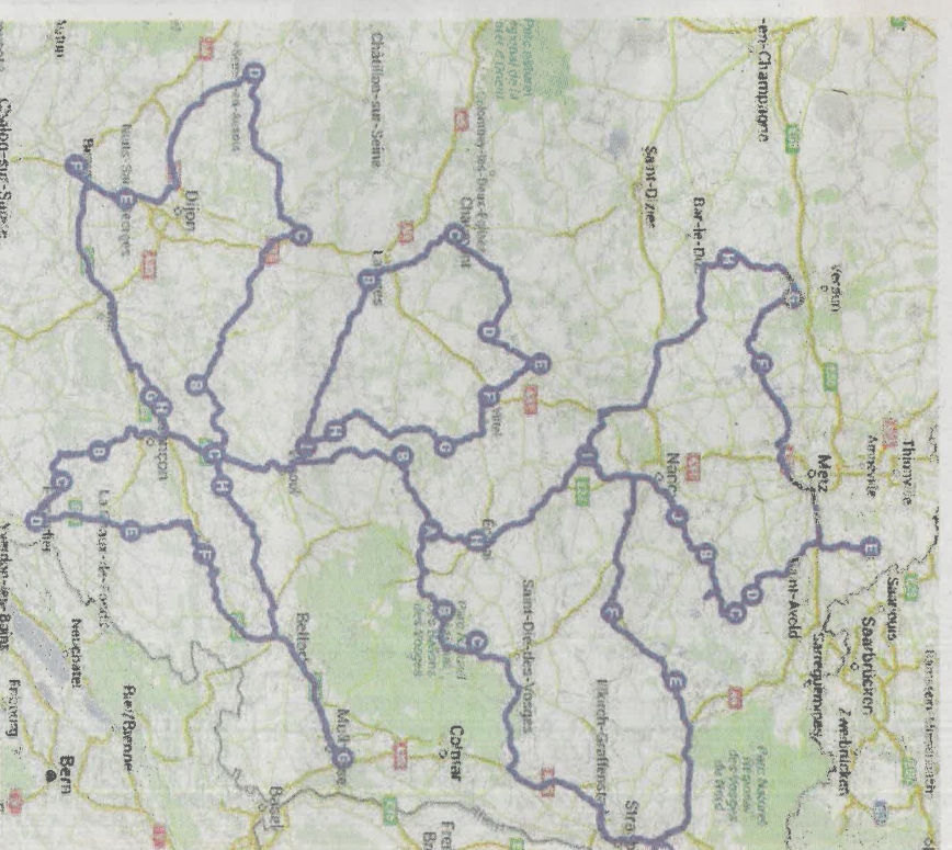
2 500 km parcourus chaque jour pour collecter les échantillons